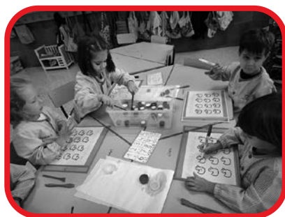
Trabajo en rincones