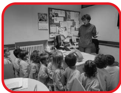
Aprendizaje basado en proyectos