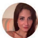
Eiza Termini Servizio Civil Italiano