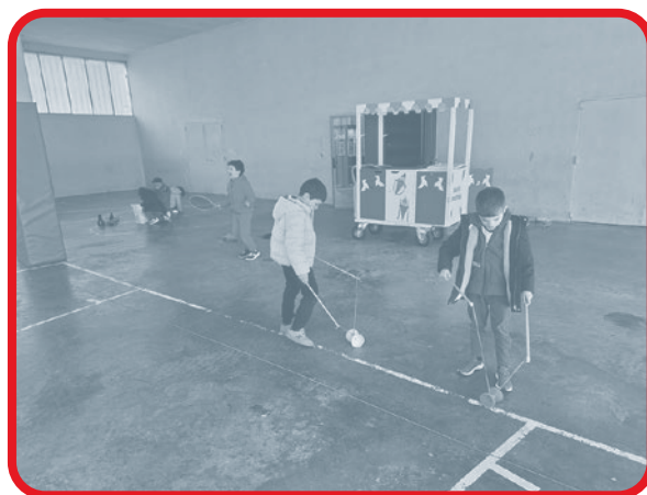
Ciudad de los Niños y de las Niñas