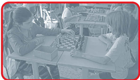
Ajedrez en la escuela

Nuestro proyecto educativo se orienta a la consecución del pleno desarrollo de la personalidad y de las capacidades y de los alumnos; la educación en la responsabilidad individual y en el mérito y esfuerzo personal, y el desarrollo de la capacidad de los alumnos para regular su propio aprendizaje, confiar en sus aptitudes y conocimientos, así como para desarrollar la creatividad, la iniciativa personal y el espíritu emprendedor. Por todo ello fomentamos programas dirigidos a la adquisición y mejora de las competencias clave.