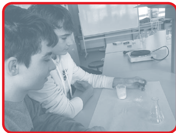
Ámbitos de aprendizaje