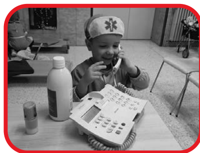
Ambientes de aprendizaje